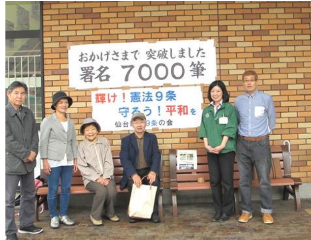
達成記念にみんなで 10月8日(土)

みやぎ生協榴岡（つつじがおか）店の前をお借りして毎月署名活動を行ってきました。さらに数ヶ所の医院の待合室に署名用紙を置かせてもらい毎月回収に伺っています。参院選が終わってからの反応が凄い。「安倍内閣怖いですね」「9条変えてはだめですよ」「家族に自衛隊の幹部がいます。みんな苦しんでいます」などと言って、どんどん集まっています。1回の署名活動で集まる署名数がこれまでの2～3倍になっています。（大益）